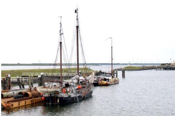
Port de Zijpe, près de Bruinisse

Moins riche en sites que l'ouest de l'île, cette zone recèle néanmoins deux sites réputés : Le Zuidbout et le Zoeterbout. De nombreuses écoles de plongée amènent leurs débutants pour leur première plongée dans l'Escaut au Zoetersbout. Ce site à l'avantage de n'être que très peu soumis aux courants et de ne pas avoir une grande sensibilité au vent. La portion de côte entre le Zuidbout et le Zonneschijn est envasée et ne se prête pas à la plongée. En dehors du Zoeterbout et de Nieuwelandje, les sites de cette zone sont sensibles au vent venant du sud. Le Noorbout et le Zuidbout y sont particulièrement sensibles.