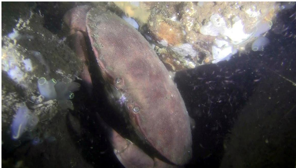
Tourteau – Crabe dormeur (FR), Noordzeekrab (NL) (Cancer pagurus)